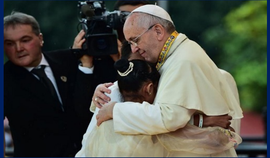
Đức Thánh Cha cúi xuống hôn cậu bé bại não.