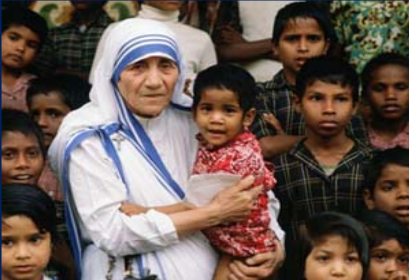
Mẹ Têrêsa Calcutta